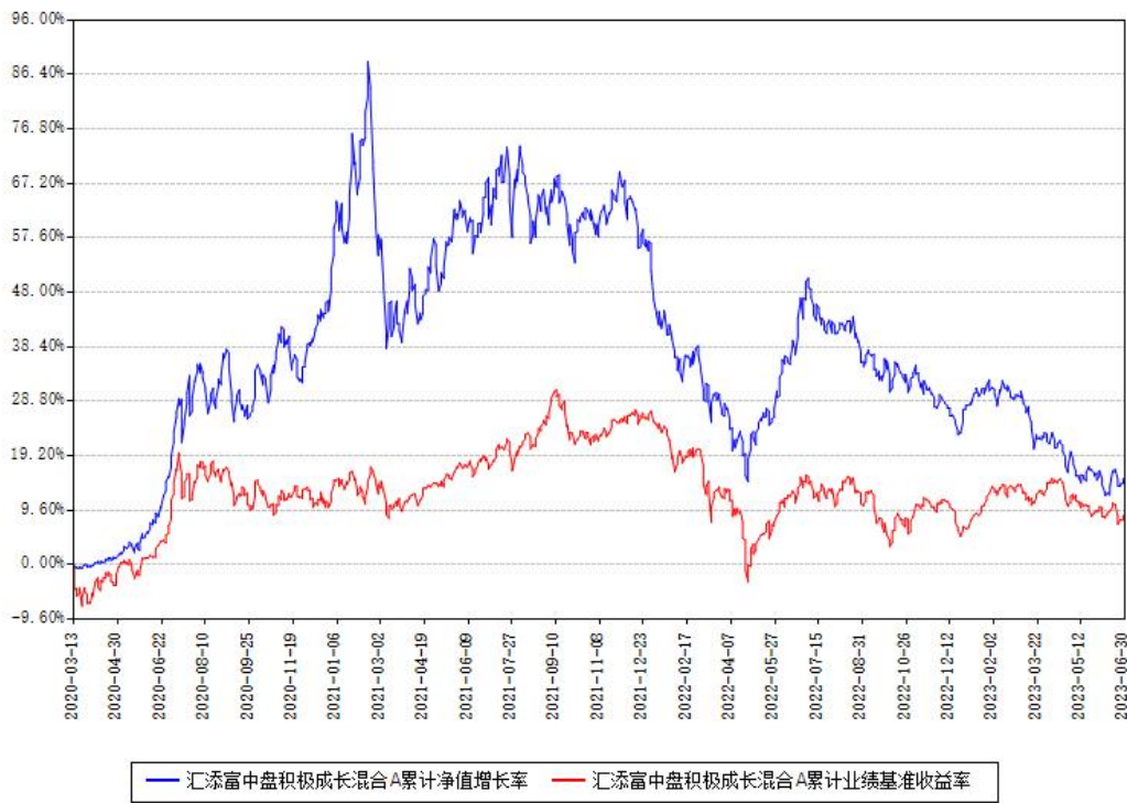
汇添富中盘积极成长混合A累计净值增长率与同期业绩基准收益率对比图