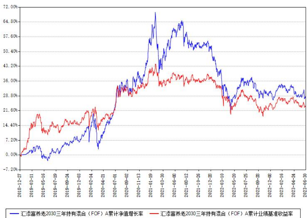
汇添富养老2030三年持有混合 (FOF) A累计净值增长率与同期业绩比较基准收益率对比图