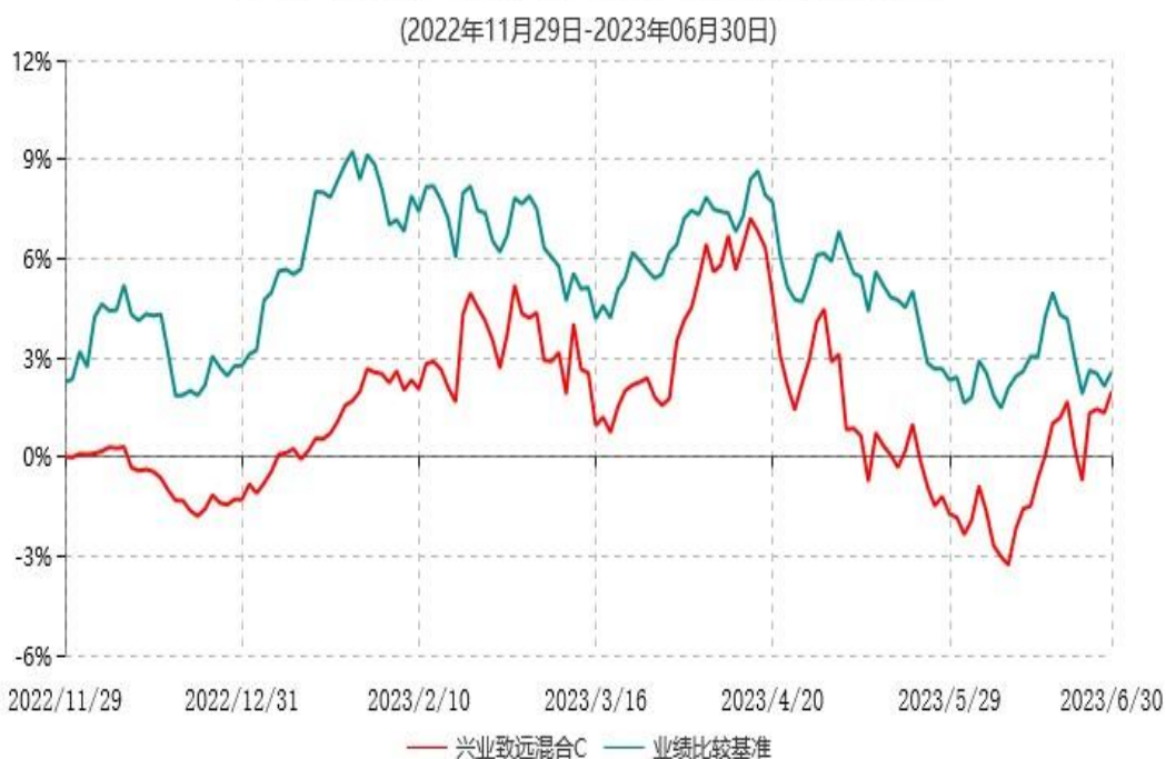
兴业致远混合C累计净值增长率与业绩比较基准收益率历史走势对比图

2、本基金基金合同于2022年11月29日生效，根据本基金基金合同规定，本基金自基金 合同生效之日起六个月内已使基金的投资组合比例符合基金合同的约定。