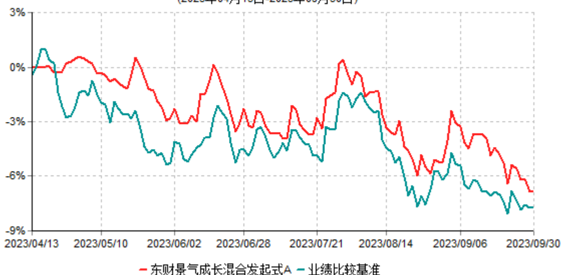
东财景气成长混合发起式A累计净值增长率与业绩比较基准收益率历史走势对比图 (2023年04月13日-2023年09月30日)